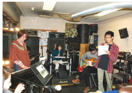
打上げの熱唱シーン